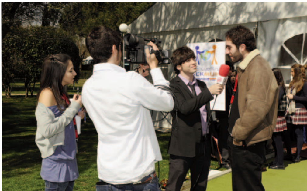
IV Encuentro SEKMUN. Trabajo periodístico.

La Presidencia lee y luego somete a votación el/los proyecto/s de resolución recibido/s.